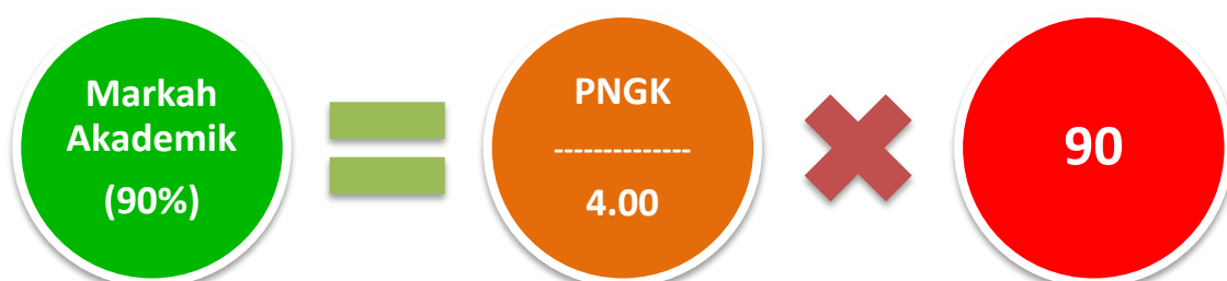
Rajah 2 - Pengiraan Markah Akademik (90%)