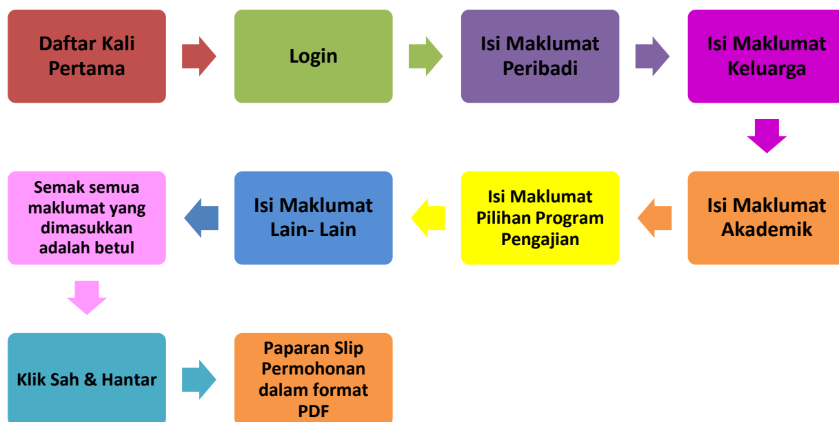
Rajah 1 - Carta Alir Permohonan UPUOnline

4.9. Sekiranya pemohon telah mendaftar, pemohon boleh login dengan hanya menggunakan Nombor Kad Pengenalan dan Kata Laluan yang telah dimasukkan semasa Daftar Kali Pertama dibuat