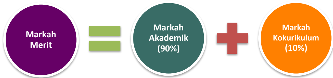
Rajah 3 - Pengiraan Markah Merit

5.11 Contoh Pengiraan Markah Merit adalah seperti di Lampiran A .