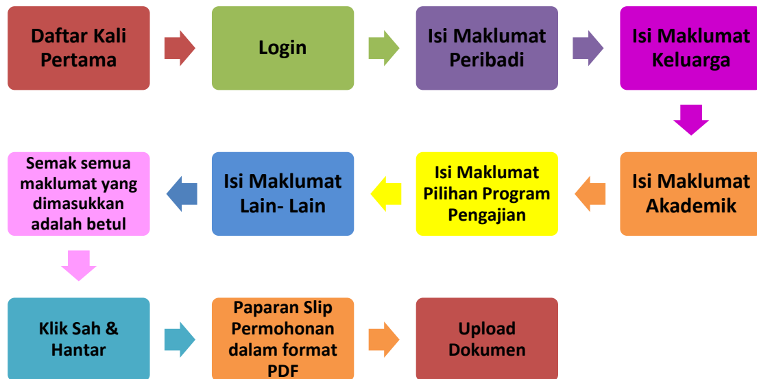
Rajah 1 - Carta Alir Permohonan UPUOnline